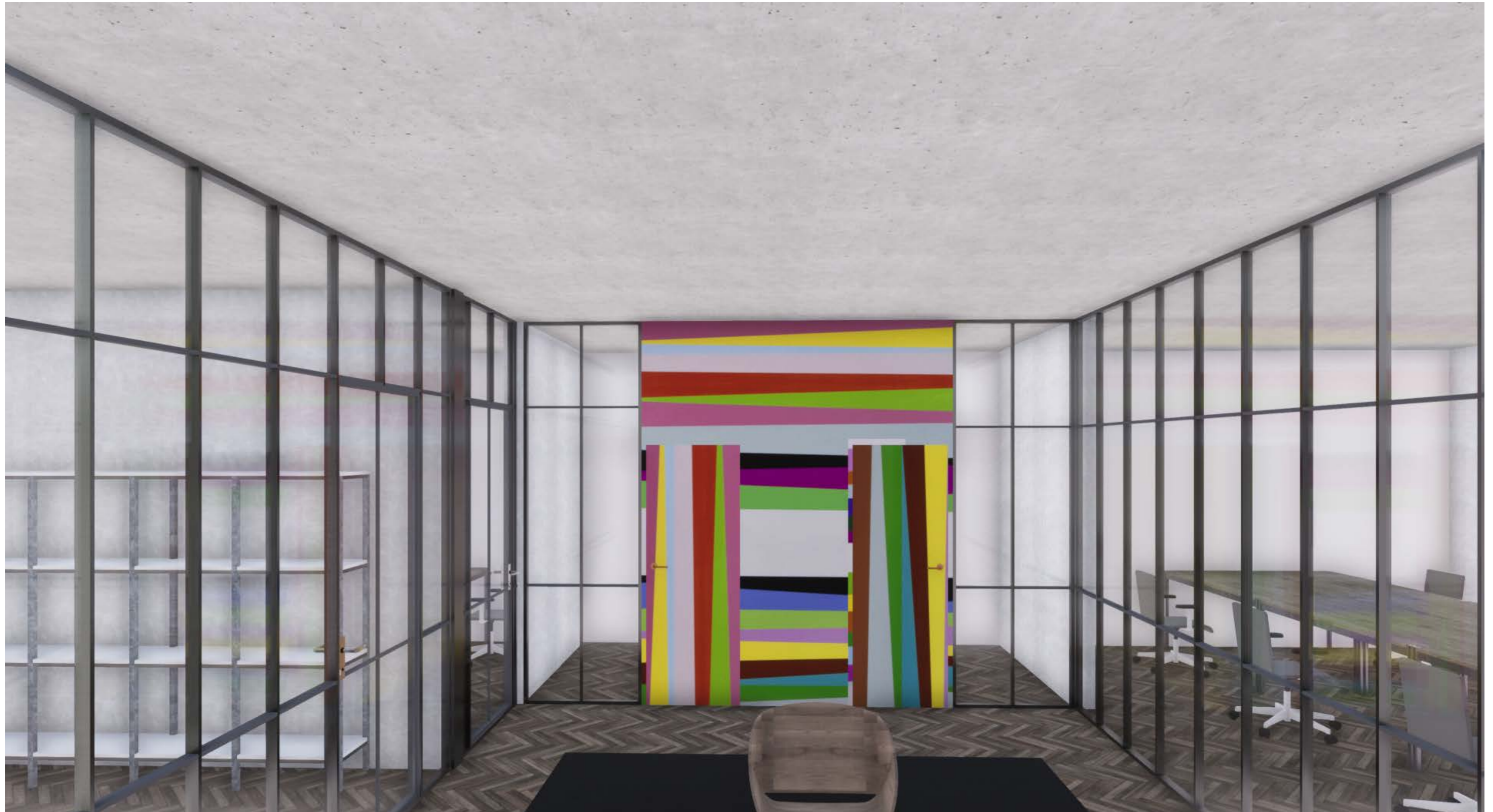
INNENRAUM CONZEPT 2.OBERGESCHOSS