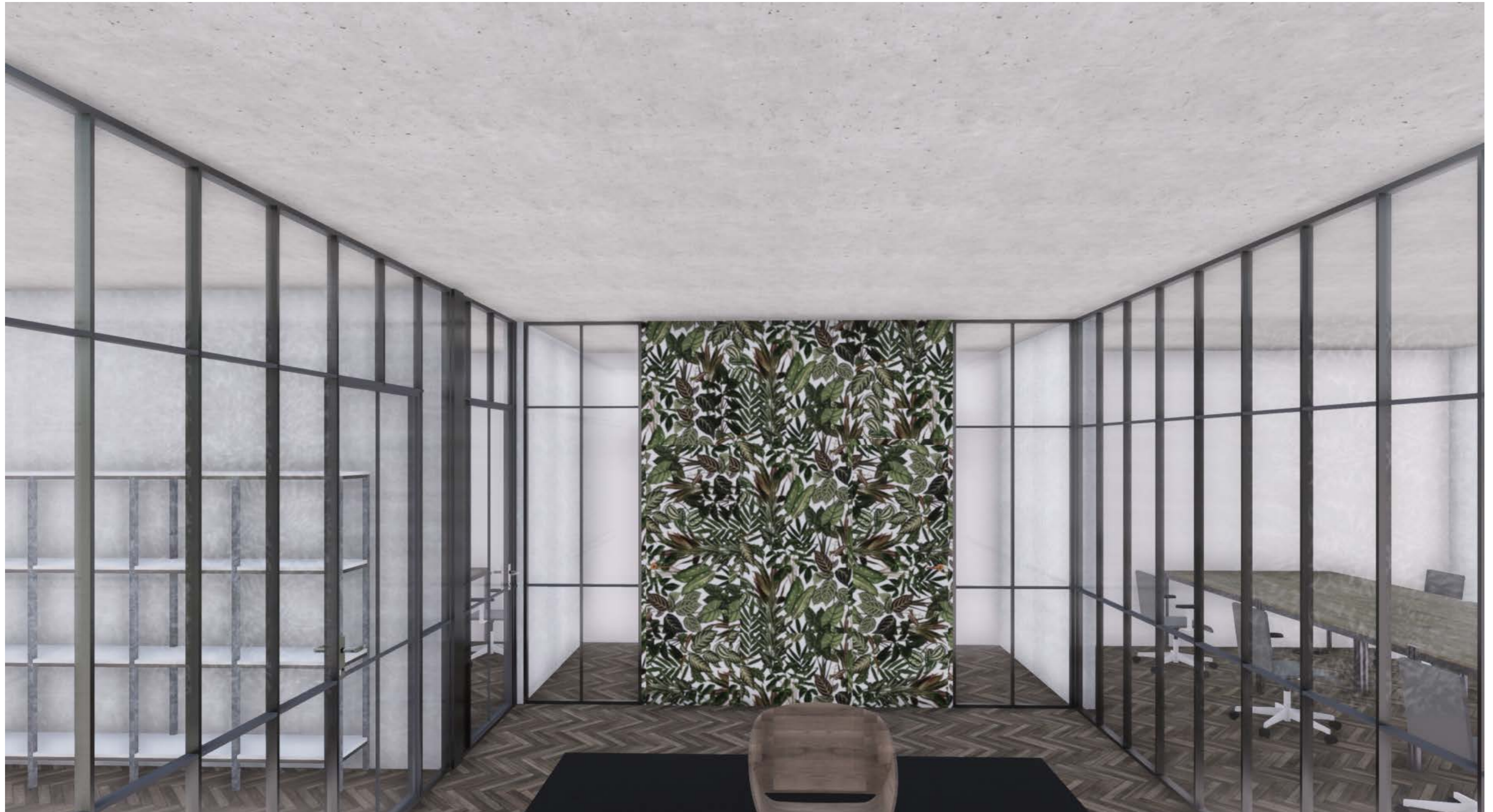
INNENRAUM CONZEPT 2.OBERGESCHOSS